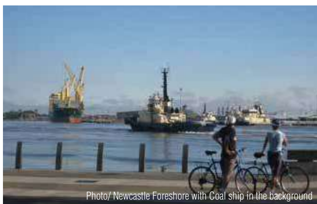
Photo/ Newcastle Foreshore with Coal ship in the background

A fin de incrementar la infraestructura destinada a las ciclovías y fomentar una cultura de ciclismo en las ciudades de Newcastle y Lake Macquarie, desde el año 2015 la Red de Ciclismo Seguro -CSN, por sus siglas en inglés CycleSafe Network- comenzó la implementación de un proyecto enfocado en romper las barreras que enfrenta el ciclismo y generar conectividad para que la ciudadanía pueda caminar y andar en bicicleta en ambientes seguros.