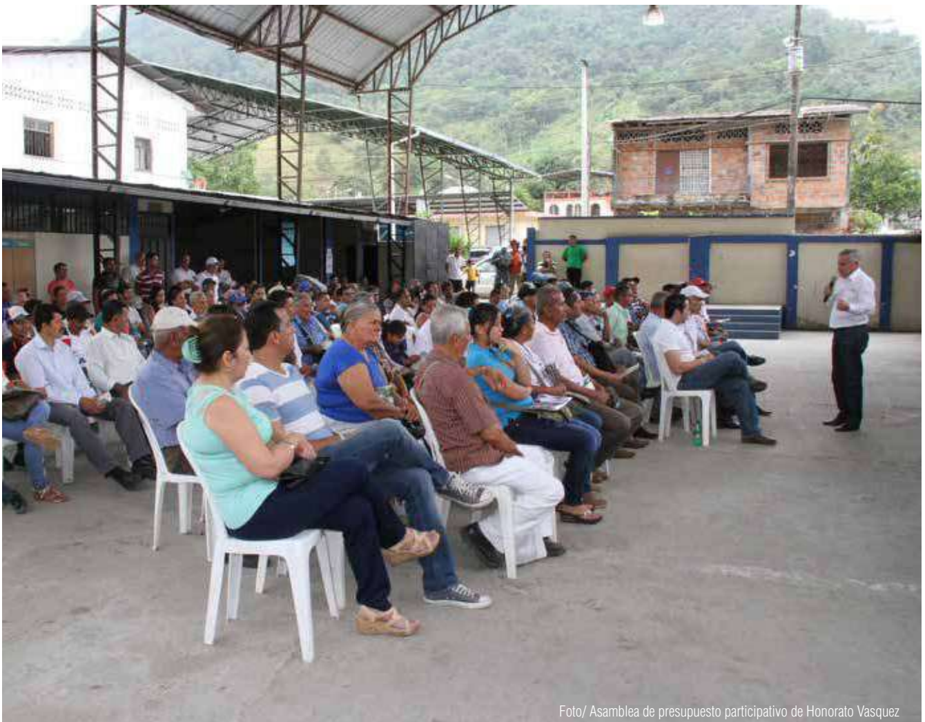
Foto/ Asamblea de presupuesto participativo de Honorato Vasquez