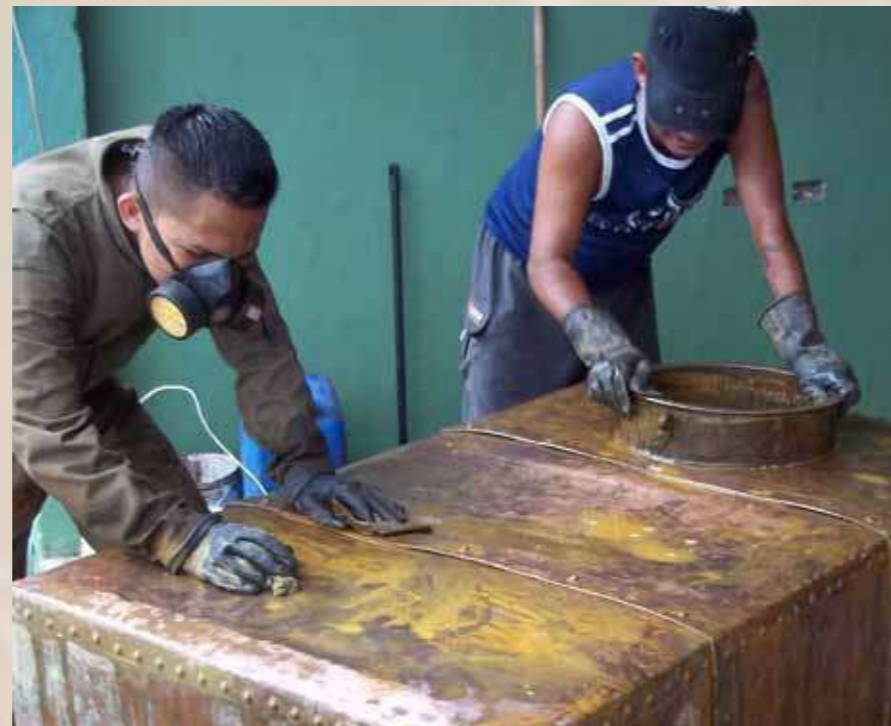
Limpieza profunda química del tanque de cobre.