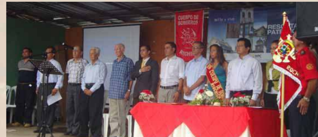
Varios ex bomberos de Riochico participaron en la inauguración