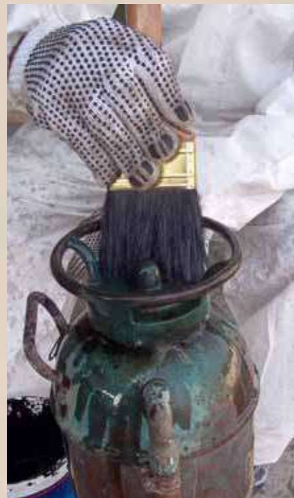
Limpieza con jabón neutro.