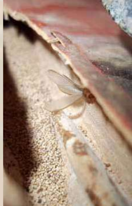
Los xilófagos destructivos habían formado cavernas internas en varios elementos de madera.