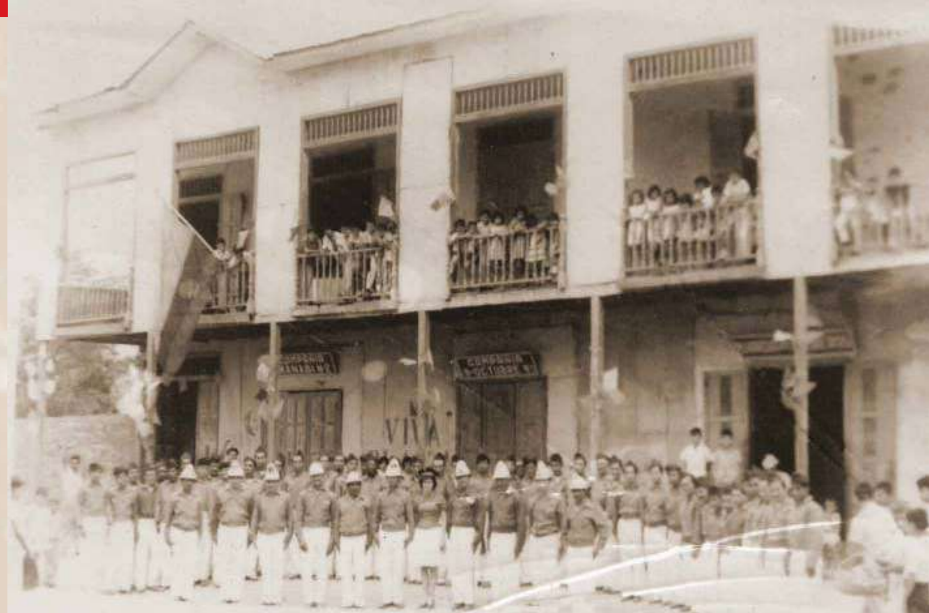
El Cuerpo de Bomberos de Riochico "Miguel Hilario Alcívar" fue creado en 1889, tras el gran incendio de 1874 que destruyó gran parte de esa población.