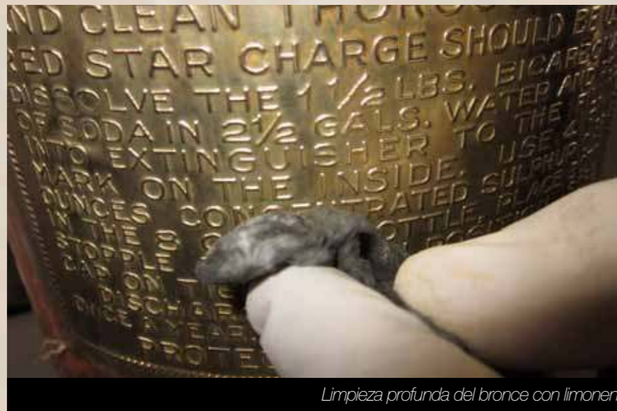
Limpieza profunda del bronce con limoneno.

Mediante técnicas artesanales se reprodujeron los detalles originales en madera (guayacán), previamente seleccionada, que fue preservada, tallada y moldeada de acuerdo con el soporte original. De igual manera, en el hierro se realizaron trabajos de sustitución de faltantes y colocación del hilado en las roscas, trabajadas en el torno con mucha delicadeza y precisión.