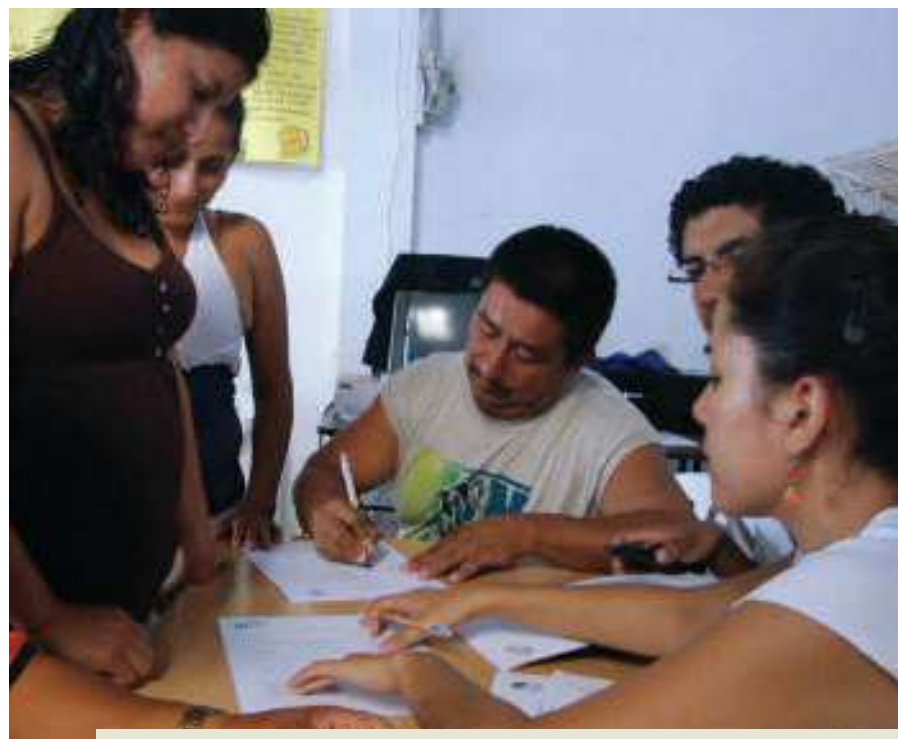
Inscripciones para la Escuela Taller en la Casa Comunal de Pile