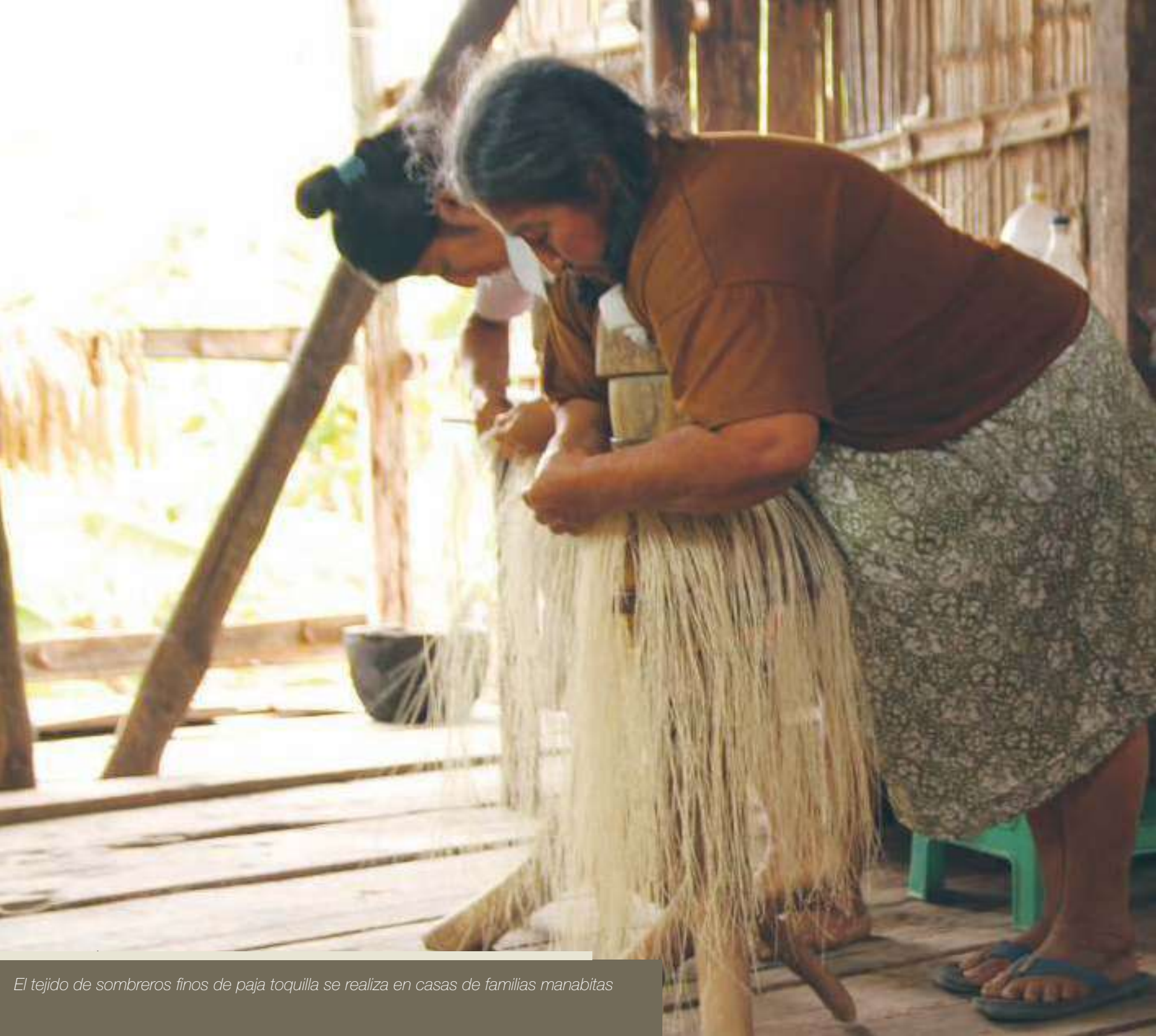
El tejido de sombreros finos de paja toquilla se realiza en casas de familias manabitas