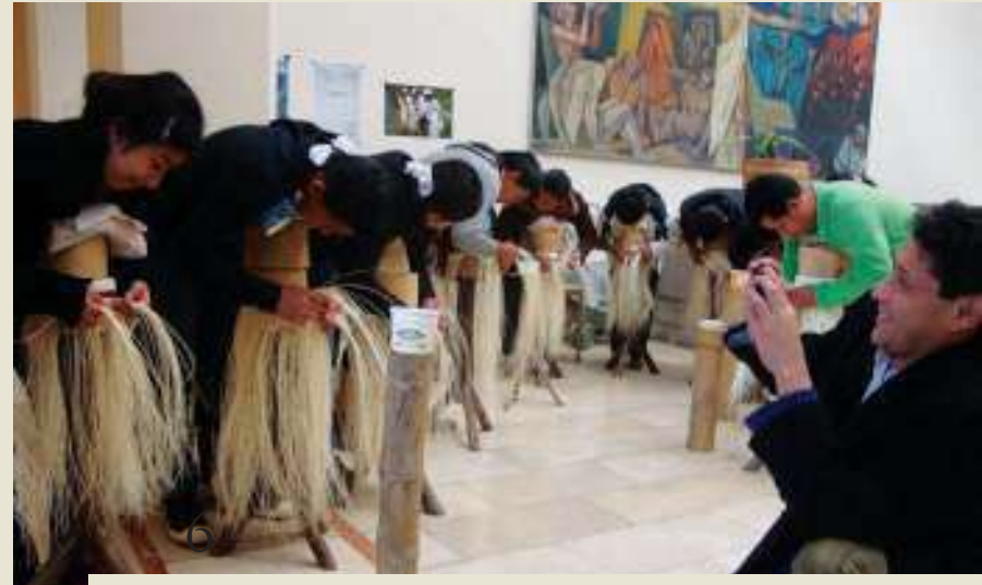
Artesanos muestran en Quito su conocimiento en el tejido del sombrero de paja toquilla

Se legitimó la presencia histórica del sombrero de paja toquilla y se resaltó la urgencia de revitalizar su proceso de producción y comercialización local. Los artesanos expresaron la necesidad de mejorar las condiciones de este grupo humano que deja su vida y su conocimiento en el trabajo de entrelazar hebras.