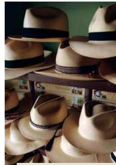
Sombreros listos para la venta después de la compostura

Si el cliente requiere un modelo especial como el fedora, el borsalino o el óptimo, se usan las hormas de estos estilos y se procede a plancharlo. Una vez terminado el proceso, el sombrero se deja orear por unos minutos y, si se lo va a guardar o a exportar, se lo dobla en una caja de palo de balsa, en caso contrario, se lo pone en la vitrina para la exhibición.