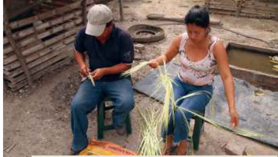
Despichado, técnica que consiste en retirar las orillas y la vena de cada cogollo antes de cocinar la paja

La riqueza natural de Manabí, con sus variados ecosistemas, favorece el crecimiento de la palma conocida como toquilla ( Carludovica palmata ). Junto a ríos y esteros, así como en las comunidades rurales de Anegados, cerro Hornilla, El Aromo y Agua Fría se puede encontrar gran cantidad de toquillales, desde donde se selecciona cuidadosamente la materia prima que se empleará en la elaboración de los sombreros.