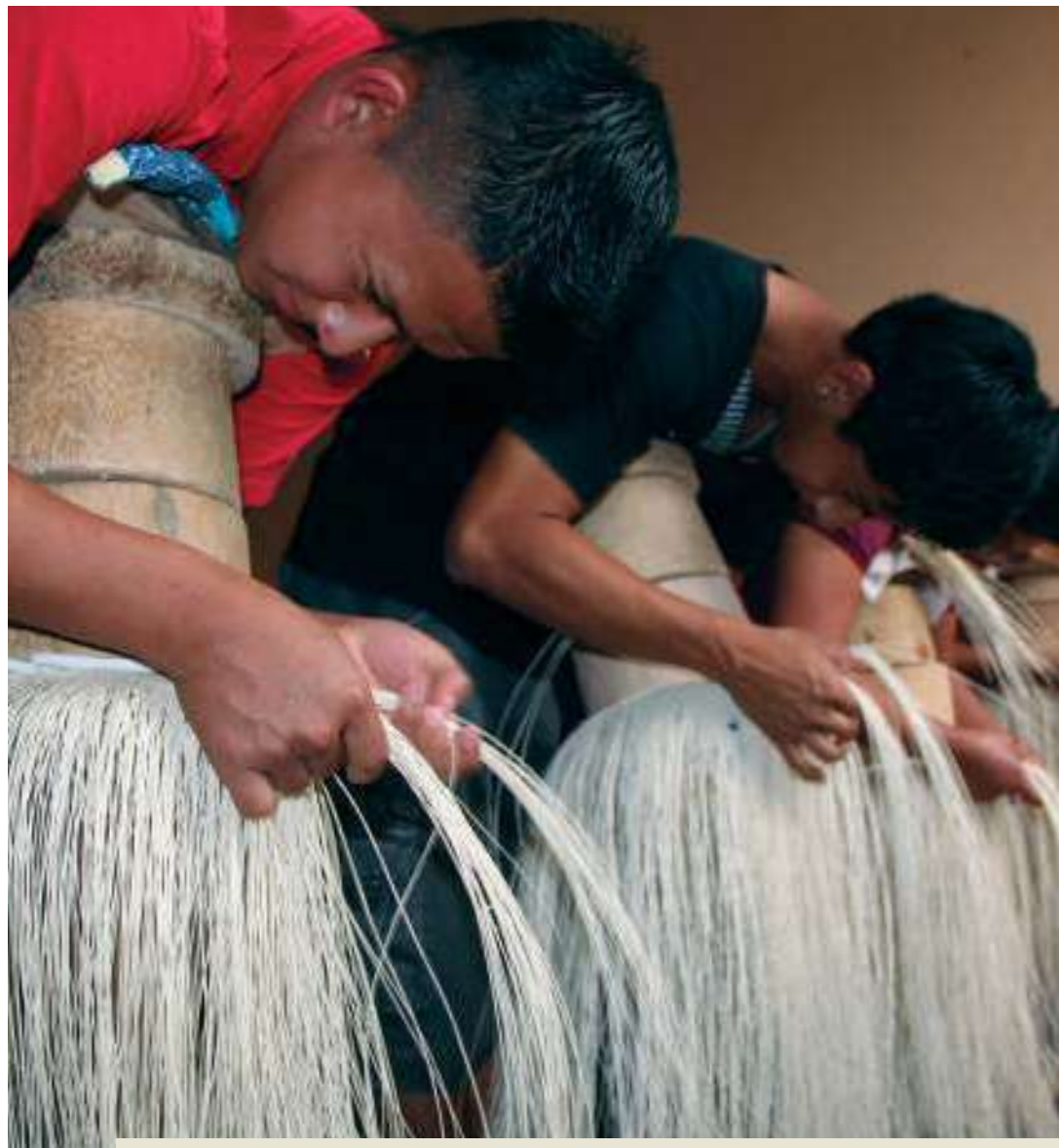
Jóvenes de Pile perfeccionan las técnicas de tejido en la Escuela Taller