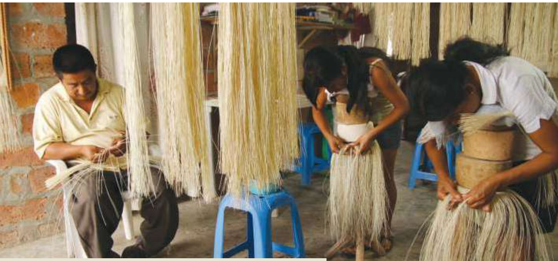
Familia de la comuna Pile en Montecristi que se dedica al tejido de sombreros finos de paja toquilla

En Manabí, la elaboración de un sombrero fino puede tomar de cuatro a seis meses de trabajo continuo y requiere de cuidados especiales. Uno de ellos es realizar el tejido en un clima fresco para evitar que las manos suden y se manche la paja. Algunos tejedores complementan su trabajo artesanal con actividades agrícolas, aunque otros prefieren no hacerlo ya que la agricultura desgasta la yema de los dedos y, por ende, se pierde la sensibilidad para tejer.