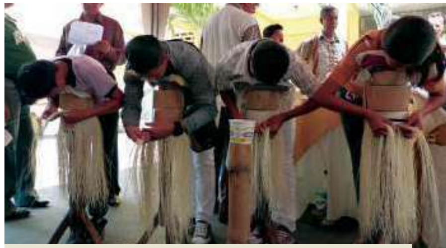
Jóvenes que se capacitan en la Escuela Taller de Pile realizaron una demostración del tejido luego de su declaratoria como Patrimonio Cultural Inmaterial de la Humanidad

La particular forma de tejer el sombrero en Manabí se diferencia de las demás localidades en que el proceso de elaboración es artesanal. En la sierra, el tejido es parte de las actividades cotidianas de las tejedoras, se teje al caminar, al pastorear o mientras se reúnen a conversar.